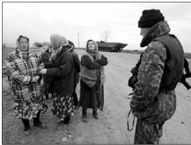
Abitanti del villaggio di Komsomolskoie distrutto dai bombardamenti federali

Il neo-eletto Presidente russo ha però ribadito ieri che la Cecenia «sarà liberata dai banditi» e che «la vita pacifica sarà ripristinata nella regione». L'attuale Governo russo — guidato dal facente funzioni e primo vice Premier, Mikhail Kasjanov, dopo l'ascesa di Vladimir Putin al Cremlino — deve «continuare a lavorare tranquillamente» per almeno un altro mese. Lo ha detto lo stesso neo Presidente Putin, secondo quanto ha riferito oggi all'agenzia «Interfax» Kasjanov, dopo un incontro a due al Cremlino. Secondo Kasjanov, Putin — che ieri ha brindato alla vittoria elettorale nella dacia di Boris Yeltsin — ha invitato i componenti dell'Esecutivo a «lavorare tranquillamente» e a non lasciarsi distrarre dalle voci sulla formazione del prossimo Governo, perché questo — ha ribadito il facente funzioni di Primo Ministro russo — non potrà nascere se non dopo il 5 maggio, vale a dire il giorno in cui Vladimir Putin sarà ufficialmente insediato alla presidenza ed entrerà nel pieno possesso delle sue funzioni.